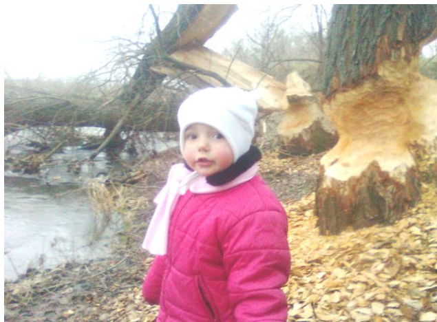
Okolí Jevišovky je letos díky bobrům hotové sci-fi