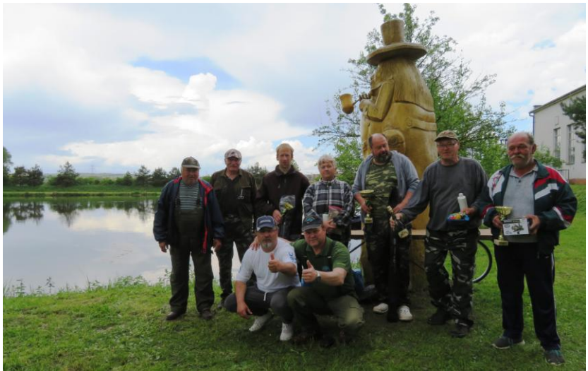
Vítězové členských závodů RS Žerotice