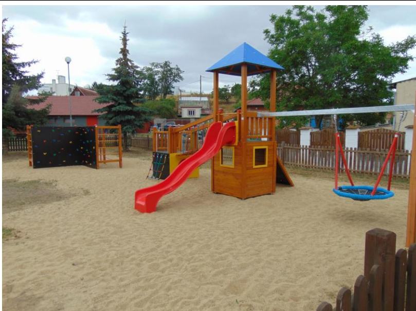
Dotace na nové dětské hřiště tentokrát vyšla 😊