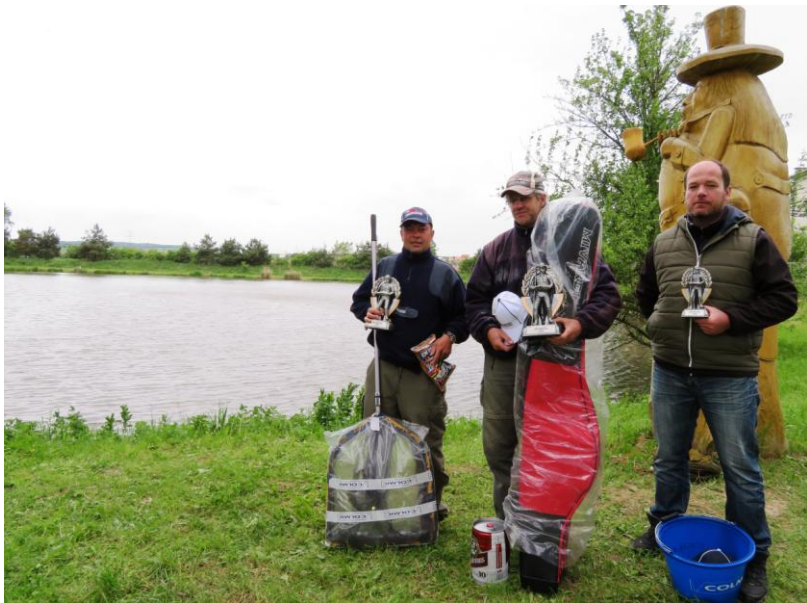
Vítězové veřejných rybářských závodů