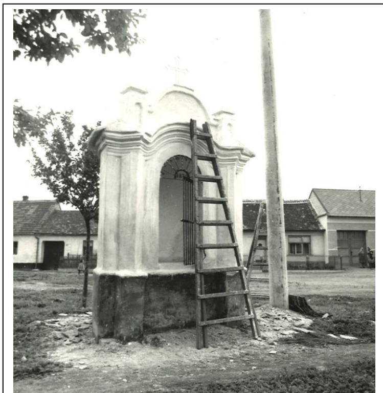
Žerotická kaplička při opravě v 50. letech

Opravou kapličky je pověřena firma Dodo Tvořihráz. Práce začnou během srpna tohoto roku. Min. kultury nám přispělo částkou 160 000 Kč.