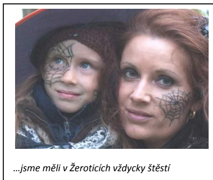
...jsme měli v Žeroticích vždycky štěstí