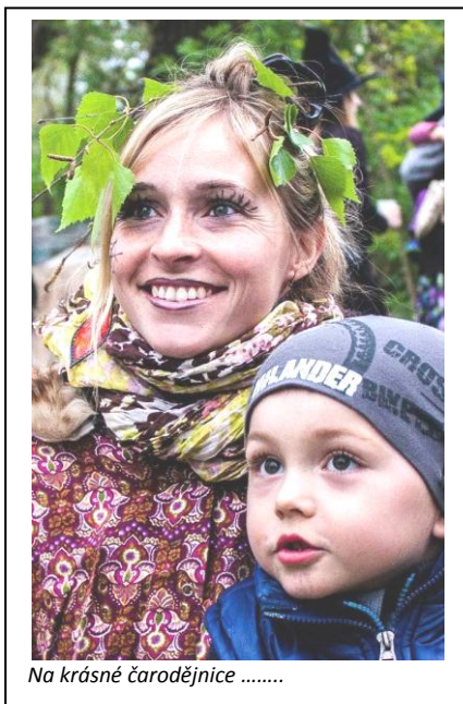
Na krásné čarodějnice .....