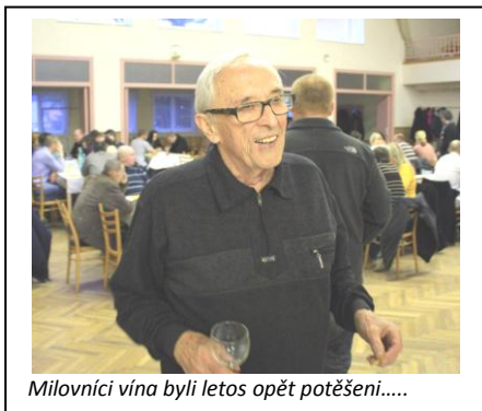
Milovníci vína byli letos opět potěšeni.....