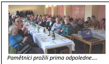
Pamětníci prožili prima odpoledne....